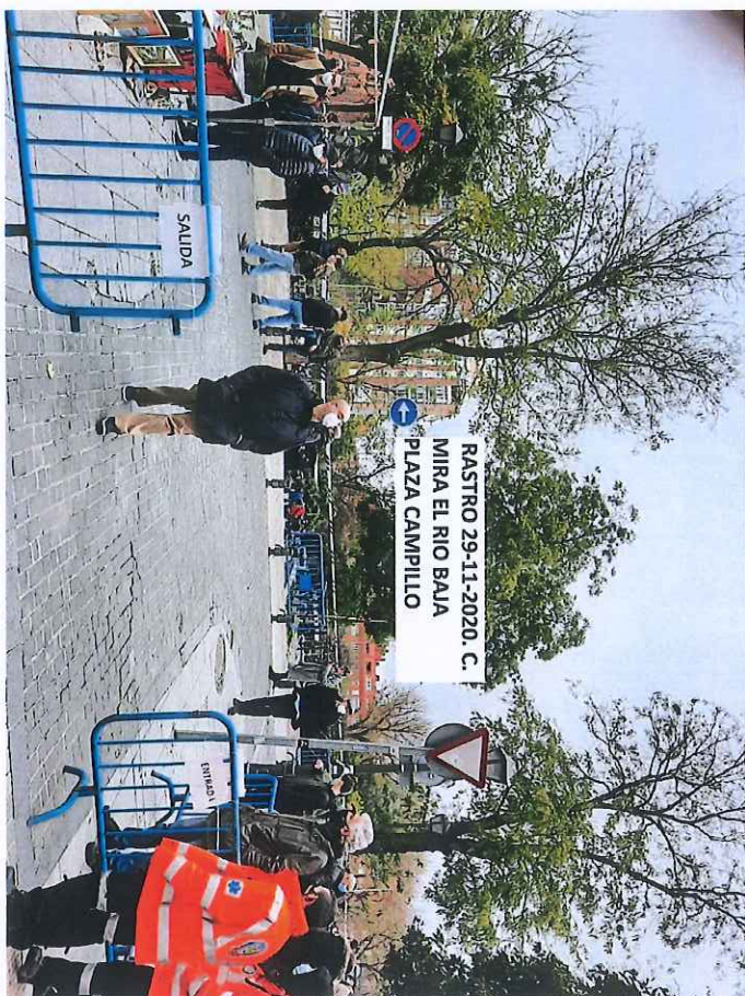
RASTRO 29-11-2020. C. MIRA EL RIO BAJA PLAZA CAMPILLO