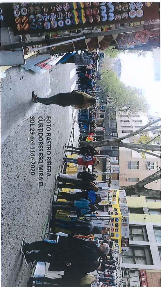
FOTO RASTRO RIBERA CURTIDORES ESQ. MIRRA EL SOL 29 del 11de 2020