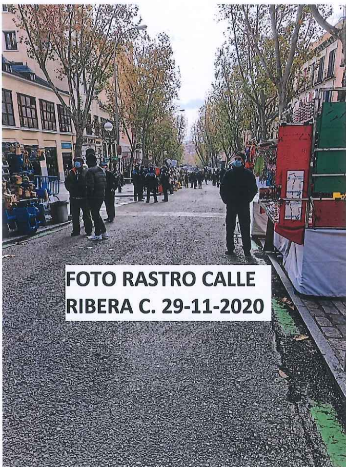
FOTO RASTRO CALLE RIBERA C. 29-11-2020