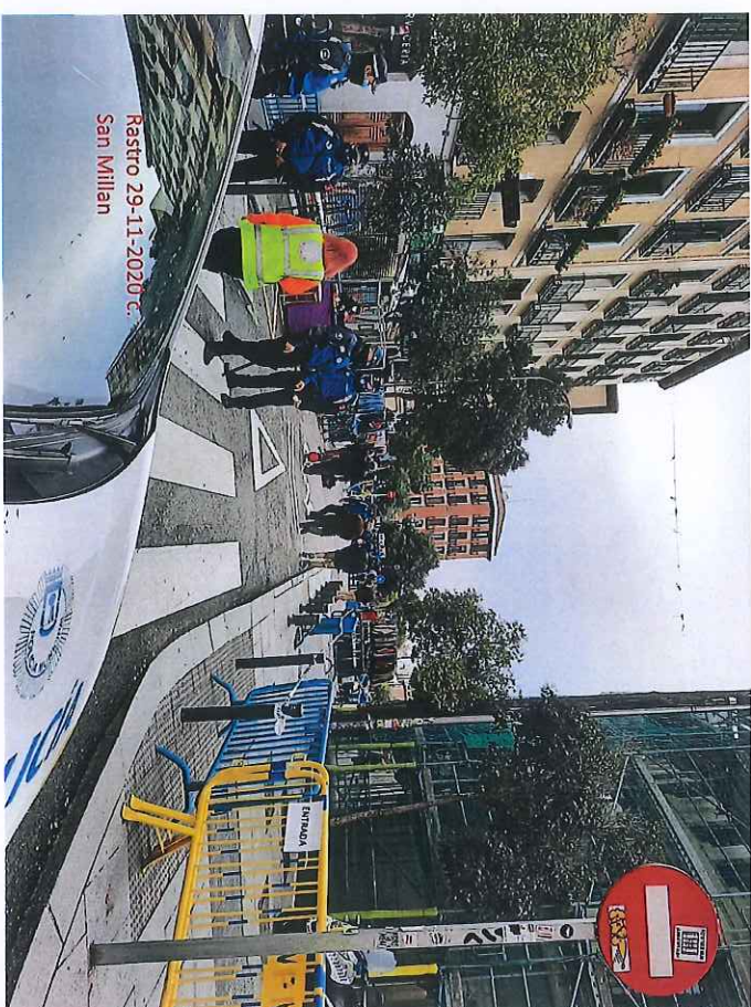
Rastro 29-11-2020 c. San Millán