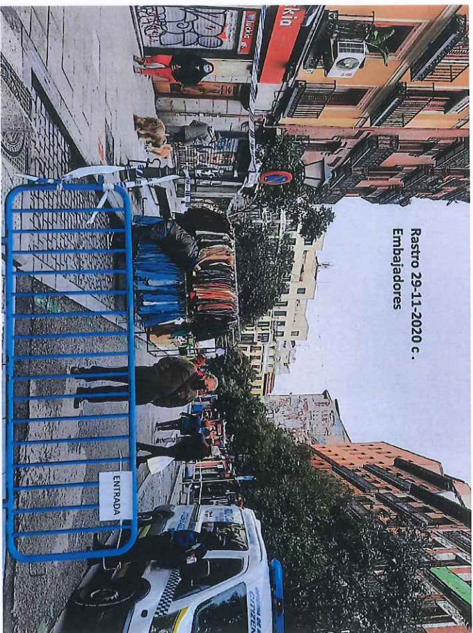
Rastro 29-11-2020 c. Embajadores