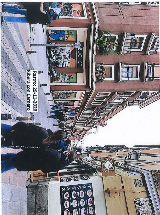
Rastro: 29-11-2020 Ribera con Camero