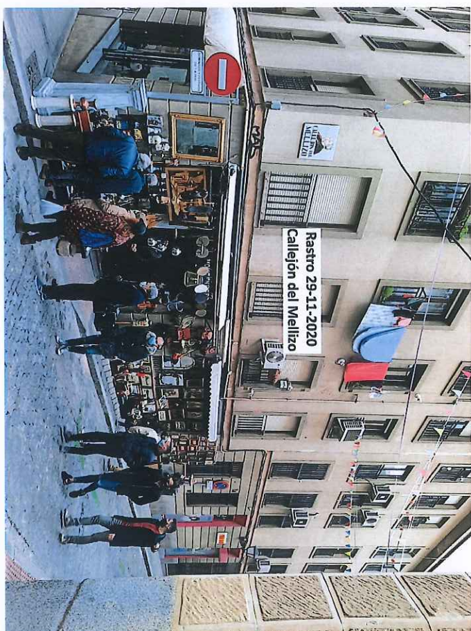
Rastro 29-11-2020 Callejón del Mellizo