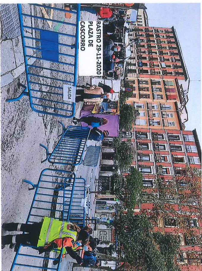
RASTRO 29-11-2020 PLAZA DE CASCORRO