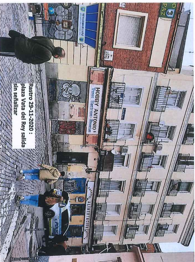
Rastro 29-11-2020 : plaza Vata del Rey salida sin señalizar