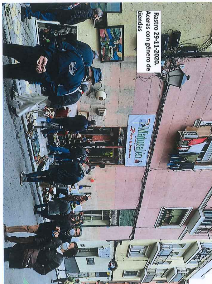
Rastro 29-11-2020. Aceras con género de tiendas